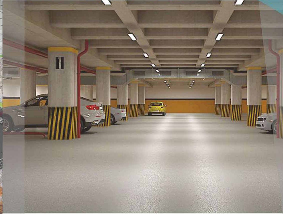
ÇOCUK OYUN ALANI & KAPALI OTOPARK