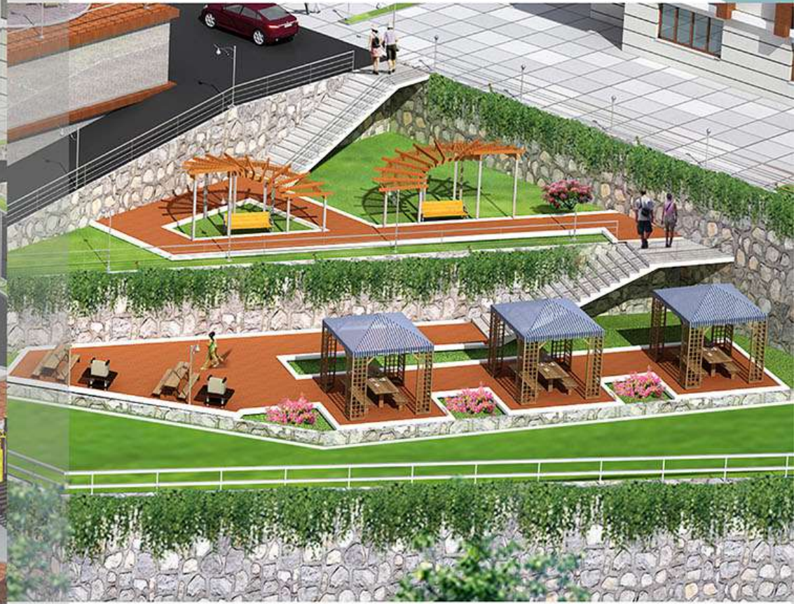
ÇOK AMAÇLI SPOR SAHASI & KAMELYA VE BARBEKÜ ALANLARI